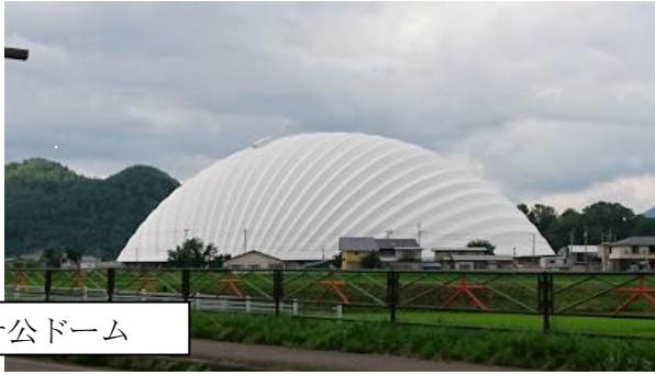
ニプロハチ公ドーム