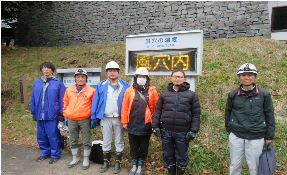
現地調査は親会や女性部メンバーにも協力を仰いで実行しました。

が、地元の令和4年5月に「長走風穴」を利用した種子貯蔵庫からこの倉庫の調査を深めるため、建築士の目線で行いました。