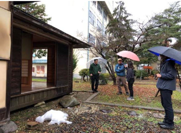
昭和61年に地元の事業家から寄付された。当時施工にあたったのは仙北支部の先輩会員。想定より痛みが少なく「いい仕事してます！」。

きっかけ 建築士会が断熱と省エネについて授業協力を進めたいとの意向を伺い、約35年前に建てられた茶室の修繕し、地域開放したいとのことから、茶室入口周りの設えの改修方法まで検討された。当日は、仙北建築士会から和風建築に詳しい大工さん、茶室の設えに詳しい建材屋さん、ヘリテージマネージャの建築士が参加した。調査は2023年11月に行われた。