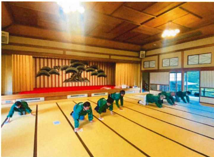
2階大広間の畳拭き（1）

能代山本建築士会青年委員会がメインとなり会員全体に呼びかけ 皆で楽しく清掃を行います。主に畳や建具の拭き掃除を行います が、2階の大広間の畳拭きは大変ですがやり甲斐があります。