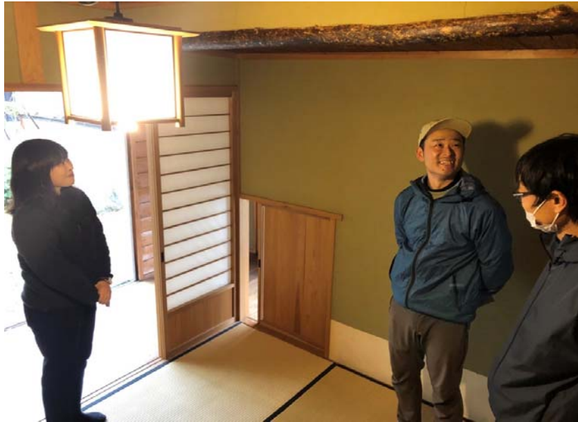
茶道を指導する先生と調査中の会員の様子。公立の中学校の敷地内に茶室があるのは珍しい。