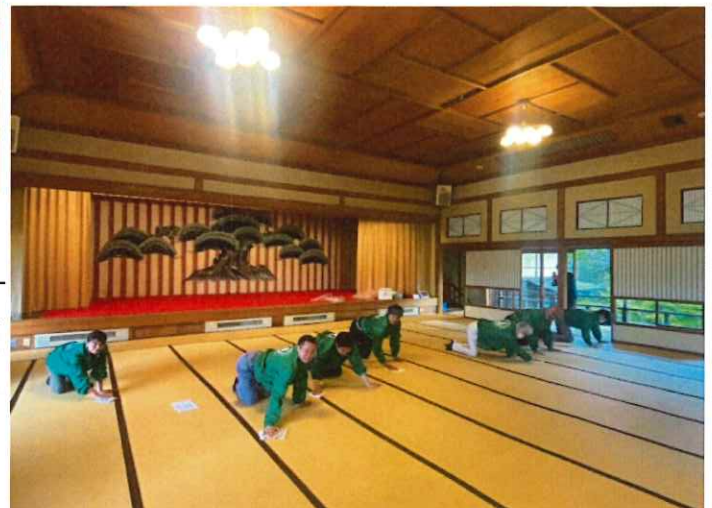
2階大広間の畳拭き（2）

『旧料亭金勇』のスタッフさん達には大変喜んでいただき、我々 能代山本建築士会のPRにもなりとても良い事業だと思っております。 これからも能代が誇る国登録有形文化財を守るために続けて 行きたいと考えております。今度は違う清掃箇所もチャレンジし てみたいと思います。