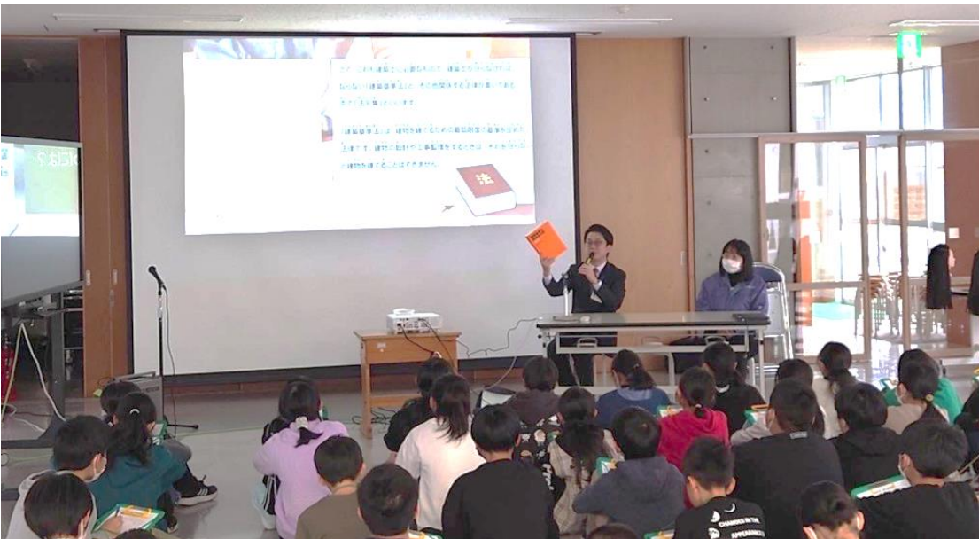
1校目の開催風景です。人数が多く、プロジェクターを使って建築士の紹介をしました。

キャリア教育をとおして、次世代育成の チャンスを探ってみよう きっかけ 令和5年度、偶然に小学校から依頼を受けてスタートした事業で、職業体験学習を通して建築士という資格を知ってもらい、地元建築業界の次世代育成につなげることを目的に活動しています。