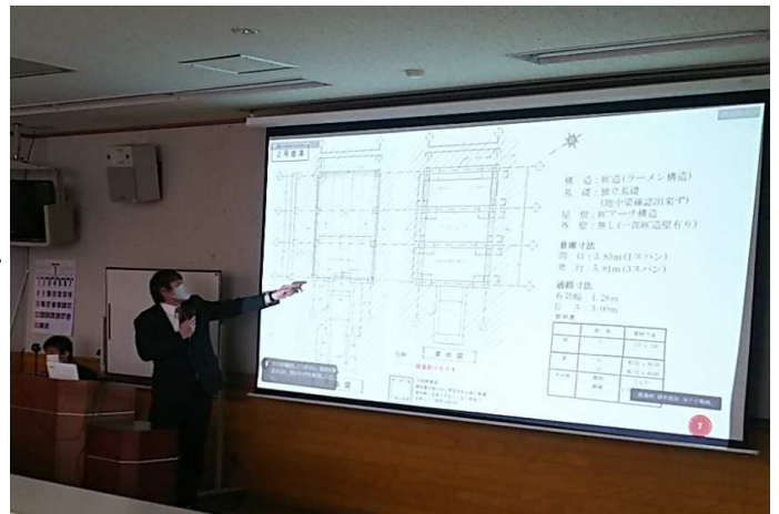
全国風穴サミットで発表している様子。当支部の幹事長が説明しています。

今年度は不可視部分の解明と土圧対策の検討を進めるべく、堆積土の試掘調査を計画していました。高山植物（天然記念物）の群生地という制約はあるものの、管理者と調査計画について協議を終えるところまで来ていましたが、全国ニュースでも話題になった「クマ出没の激増」により断念せざるを得ませんでした。しかしコロナを乗り越えた我々にとって、このくらいのことで諦める理由にはなりません！来年度こそはこの計画を実行に移したいと思えます。