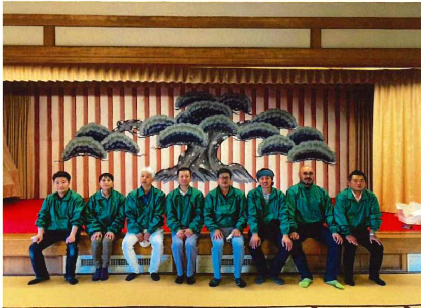
清掃終了後 集合写真