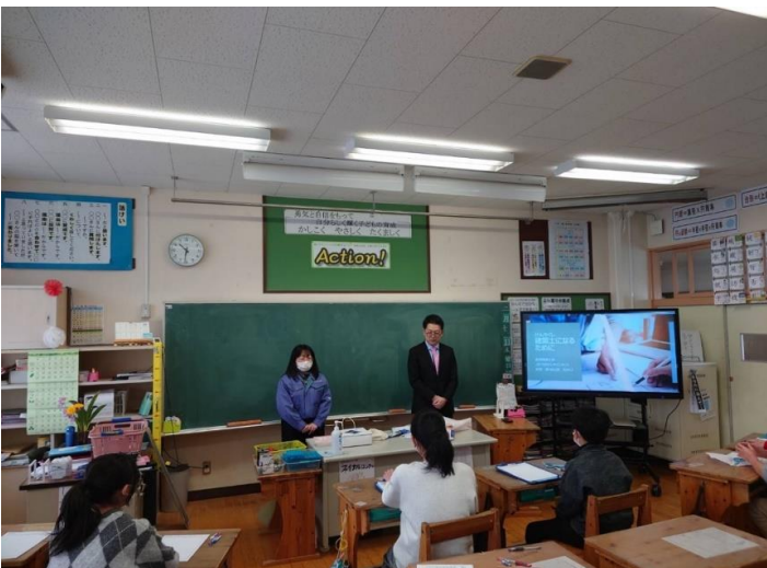
2校目の開催風景です。電子黒板が上手く使えず、建築士の紹介に入るまで時間がかかりました。

キャリア教育をとおして、次世代育成の チャンスを探ってみよう きっかけ 令和5年度、偶然に小学校から依頼を受けてスタートした事業で、職業体験学習を通して建築士という資格を知ってもらい、地元建築業界の次世代育成につなげることを目的に活動しています。