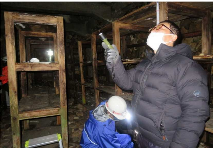
倉庫は3方向が地中に面して積石で覆われており、風穴の冷気を取り入れる工夫がされています。写真は2号倉庫の様子。

二つの倉庫について現地調査を行いました。どちらもRC造ですが、工法の違いから建築年代が異なることがわかりました。調査結果は図面化し、劣化状況の記録と保守についての提言をまとめました。また過去の文献や資料から、建て替え前の木造倉庫（昭和初期）についても図面化しました。これらの成果は、他団体主催の「全国風穴サミットin大館」で発表させていただきました。地域にはまだ認知されていないコンテンツが眠っている可能性があり、そうした宝で全国的に交流できることを今回の事業で感じることができました。