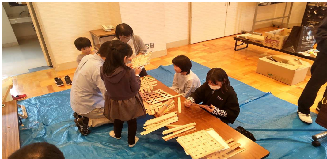
子どもたちの網代編みの製作状況

きっかけ 横手市子ども会育成連合会主催の工作体験「つくってあそぼう」が久々に開催される。横手建築士会青年部も例年参加していたが今年度も参加した運びとなった。